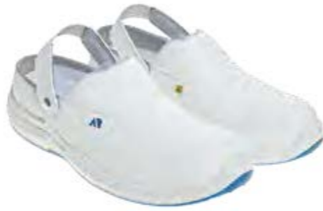
ANATOMIC ASEPTIC & FOOD ARIOSA WHITE LOW 52455 00-A