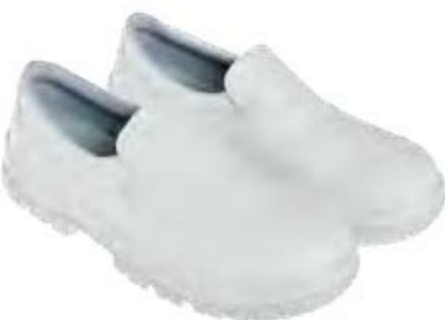
REGULAR ASEPTIC & FOOD LUCERNA WHITE LOW 25026 00-A