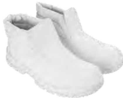
REGULAR ASEPTIC & FOOD VIENNE 25048 00-A