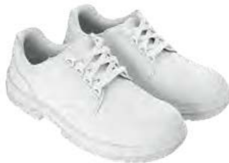
REGULAR ASEPTIC & FOOD VILLACH WHITE LOW 25021 02-A