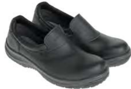
REGULAR ASEPTIC & FOOD ITALIA BLACK LOW 19267 02-A