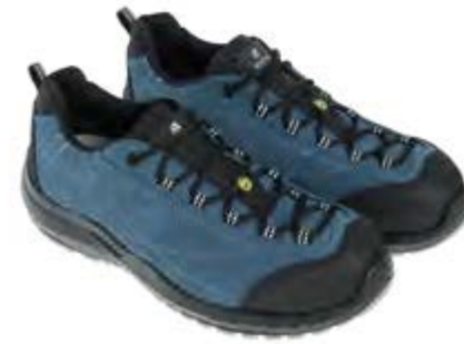
ANATOMIC PROFESSIONAL FALCON DENIM LOW 51380 01LA

S3L / FO / SR / ESD DGUV 112-191 / EN ISO 20345:2022