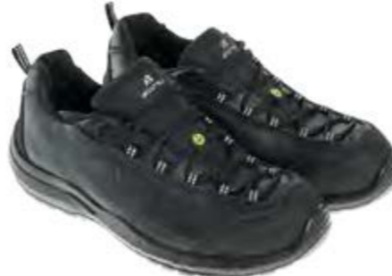
ANATOMIC PROFESSIONAL FALCON BLACK LOW 51380 02LA

S1PL / FO / SR / ESD DGUV 112-191 / EN ISO 20345:2022