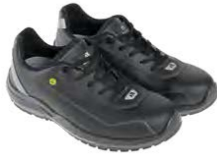
ANATOMIC PROFESSIONAL EVO BLACK LOW 51432 00LA

S3L / FO / SR / ESD DGUV 112-191 / EN ISO 20345:2022