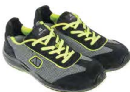
ANATOMIC PROFESSIONAL EXPLORER GREY-YELLOW LOW 51375 06LA

S1PL / FO / SR / ESD DGUV 112-191 / EN ISO 20345:2022