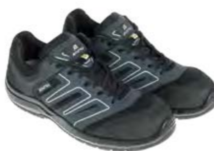
ANATOMIC PROFESSIONAL INDIANAPOLIS BLACK LOW 50351 03LA

S3L / FO / SR / ESD DGUV 112-191 / EN ISO 20345:2022