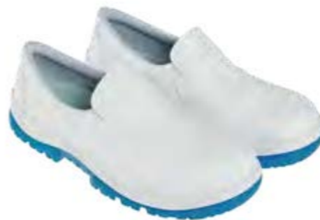
REGULAR ASEPTIC & FOOD LUCERNA BLUE LOW 25026 16-A