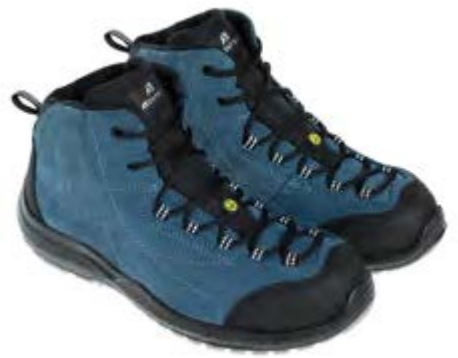
ANATOMIC PROFESSIONAL FALCON DENIM MID 51381 01LA

S3L / FO / SR / ESD DGUV 112-191 / EN ISO 20345:2022