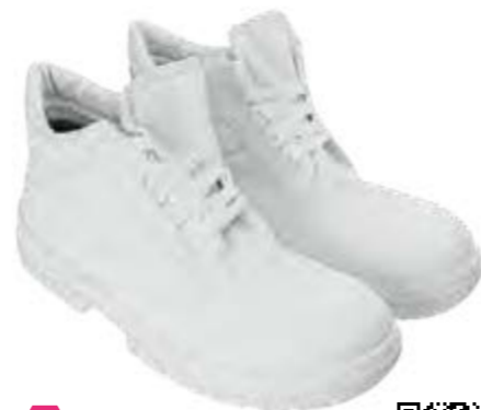
REGULAR ASEPTIC & FOOD ST. MORITZ WHITE MID 25027 00-A