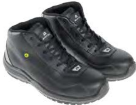
ANATOMIC PROFESSIONAL EVO BLACK MID 51433 00LA

S3L / FO / SR / ESD DGUV 112-191 / EN ISO 20345:2022