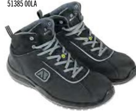
ANATOMIC PROFESSIONAL DISCOVERY BLACK MID 51385 00LA

S3L / FO / SR / ESD DGUV 112-191 / EN ISO 20345:2022