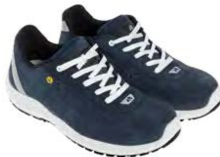
ANATOMIC PROFESSIONAL EVO NAVY FRESH LOW 51432 03LA

S1P / SRC / ESD DGUV 112-191 / EN ISO 20345:2011