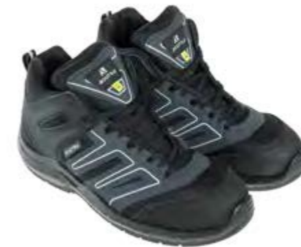
ANATOMIC PROFESSIONAL INDIANAPOLIS BLACK MID 50352 03LA

S3 / SRC / ESD DGUV 112-191 / EN ISO 20345:2011