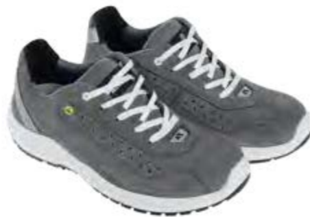
ANATOMIC PROFESSIONAL EVO GREY FRESH LOW 51432 02LA

S3 / SRC / ESD DGUV 112-191 / EN ISO 20345:2011