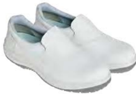
REGULAR ASEPTIC & FOOD ITALIA WHITE LOW 19267 00-A