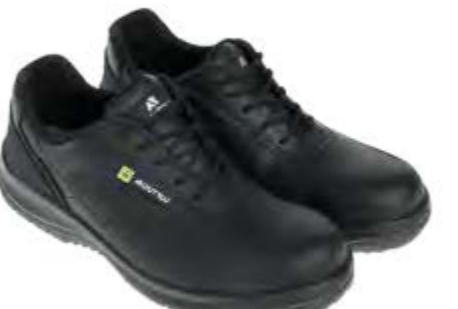
REGULAR PROFESSIONAL T-LIGHT ESD BLACK LOW 19261 12LA

S3 / SRC / ESD DGUV 112-191 / EN ISO 20345:2011