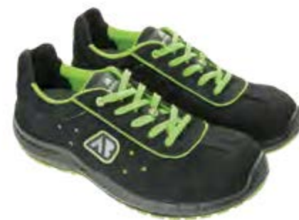
ANATOMIC PROFESSIONAL ENTERPRISE 51375 02LA

S3 / SRC / ESD DGUV 112-191 / EN ISO 20345:2011