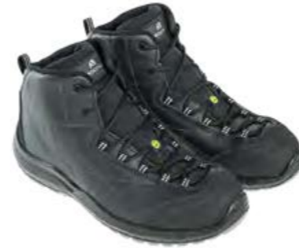
ANATOMIC PROFESSIONAL FALCON BLACK MID 51381 02LA

S3 / SRC / ESD DGUV 112-191 / EN ISO 20345:2011