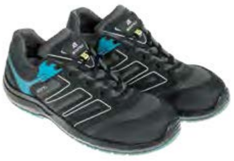
ANATOMIC PROFESSIONAL INDIANAPOLIS OCTANE LOW 50351 02LA

S3L / FO / SR / ESD DGUV 112-191 / EN ISO 20345:2022