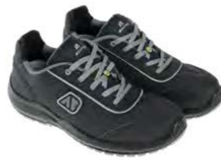
ANATOMIC PROFESSIONAL DISCOVERY BLACK LOW 51375 05LA

S1P / SRC / ESD DGUV 112-191 / EN ISO 20345:2011