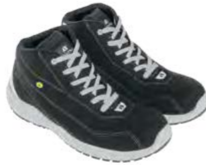
ANATOMIC PROFESSIONAL EVO VEG BLACK MID 51433 04LA

S3L / FO / SR / ESD DGUV 112-191 / EN ISO 20345:2022