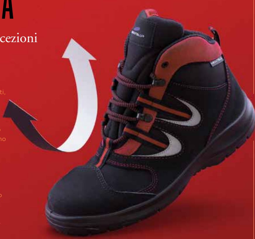
Tessuto stretch TXYFLEX

La grande adattabilità di questa linea la rende confortevole anche in caso di alluce valgo, al contempo Aboutblu Easyflex resta una scelta perfetta per chiunque cerchi una scarpa idrorepellente, traspirante e resistente a strappi ed abrasioni.