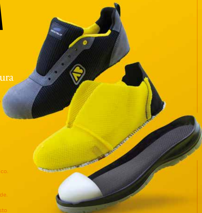
Tecnologie PLASMAFEEL e POWER CAP

Solitamente una scarpa o è performante d'inverno o lo è d'estate. Le calzature della Panther, invece riescono a dare il meglio in tutte le condizioni climatiche. Questo è possibile grazie a tecnologie come PLASMAFEEL e POWER CAP. Fodera che mantiene il piede asciutto grazie all'assorbimento del sudore e alla sua immediata dispersione all'esterno, garantendo così un ambiente antibatterico. Puntale in fibra di vetro e particolato di gomma, è il grande alleato contro le temperature estreme, sia calde che fredde. Ottimo per il mantenimento della temperatura e molto più elastico e robusto dei materiali polimerici.