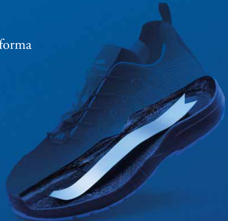
Forma anatomica inalterabile

Ottimi materiali e sofisticate tecnologie di realizzazione non bastano: la forma sbagliata della suola rende una scarpa scomoda. Per questo il lavoro di Panther è partito dalla progettazione della forma anatomica ideale per disegnare le collezioni di Aboutblu Anatomic e Panther Anatomic. Lo stampo della suola prende vita per iniezione: nasce così un'anima anatomica capace di restare inalterabile per tutta la durata della scarpa.