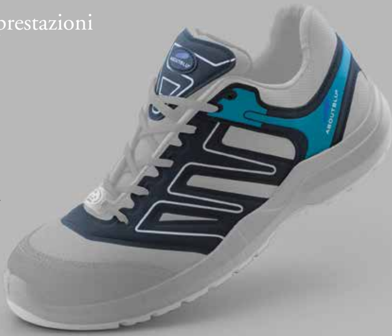
Inserti in PU

QUALCHE GRAMMO DI INSERTI IN PU SULLE ABOUTBLU INDIANAPOLIS LE RENDE PIÙ RESISTENTI A STRAPPI E TAGLI.